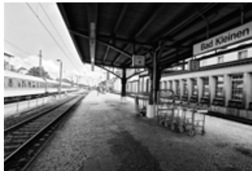
Bahnhofsansicht von Bad Kleinen

Bilder aus einem fahrenden Zug. Bilder von Gleisen aufgenommen auf der Fahrt. Eine Bahnhofssprecherin kündigt die Ankunft eines Zuges in Bad Kleinen an. Eine Schwarzblende. Stille.