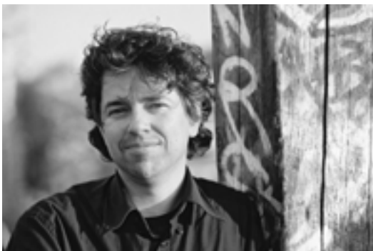
Regisseur Andres Veiel

▶ Andres Veiel wurde am 16. Oktober 1959 in Stuttgart geboren und ist dort aufgewachsen. Ab 1982 studierte er Psychologie in Berlin und schloss das Studium 1988 mit dem Diplom ab, ohne jedoch in diesem Beruf arbeiten zu wollen. Von 1985 bis 1989 absolvierte er eine Regie- und Dramaturgieausbildung im Rahmen der internationalen Regieseminare am Künstlerhaus Bethanien. Veiel lebt in Berlin, wo er auch einen Lehrauftrag an der FU Berlin für Stoffentwicklung und Dramaturgie hatte. Er schreibt Theaterstücke, Drehbücher und führt Regie. Seine erste veröffentlichte filmische Regiearbeit war der halbinszenierte Dokumentarfilm WINTERNACHTSTRAUM (1991/92). Es folgten die Dokumentarfilme BALANGAN (1993), der 1994 unter anderem mit dem Friedenspreis der Berliner Filmfestspiele und dem Deutschen Filmpreis (Filmband in Silber) ausgezeichnet wurde und DIE ÜBERLEBENDEN (1995/96), der 1996 den Hauptpreis des Internationalen Dokumentarfilmfestes München und 1998 den Adolf Grimme Preis erhielt. Nach BLACK BOX BRD (2001) ist mit DIE SPIELWÜTIGEN (1997-2002), einer Langzeitbeobachtung von Schauspielschülern, ein weiterer Dokumentarfilm geplant.