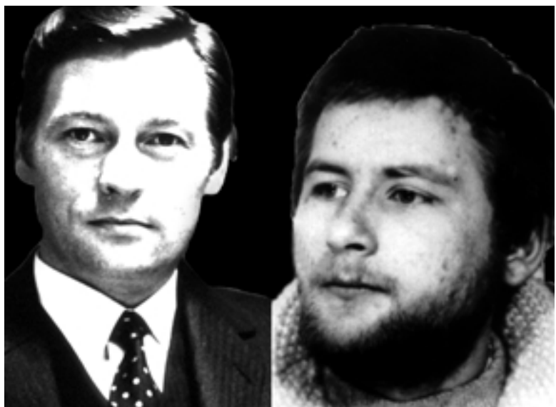
Alfred Herrhausen (links) und Wolfgang Grams (Collage)

BLACK BOX BRD ist hervorragend geeignet, zu verdeutlichen, dass dokumentarisches Erzählen nicht gleichbedeutend mit authentischem Erzählen ist, sondern auch fiktionales oder propagandistisches Erzählen mit Hilfe dokumentarischen Materials sein kann.