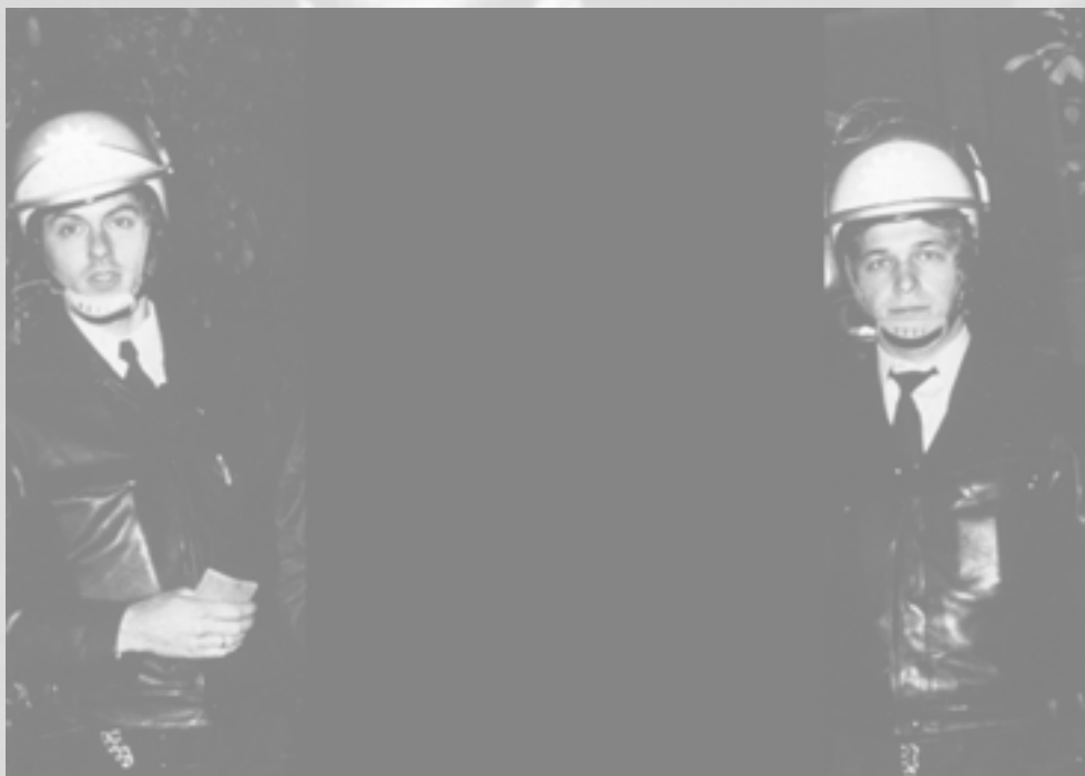
Achtung! Bearbeitetes Foto